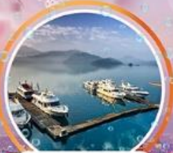
ทะเลสาบสุริยอันจินตรา