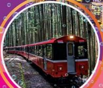
อุทยานอาลีซาน